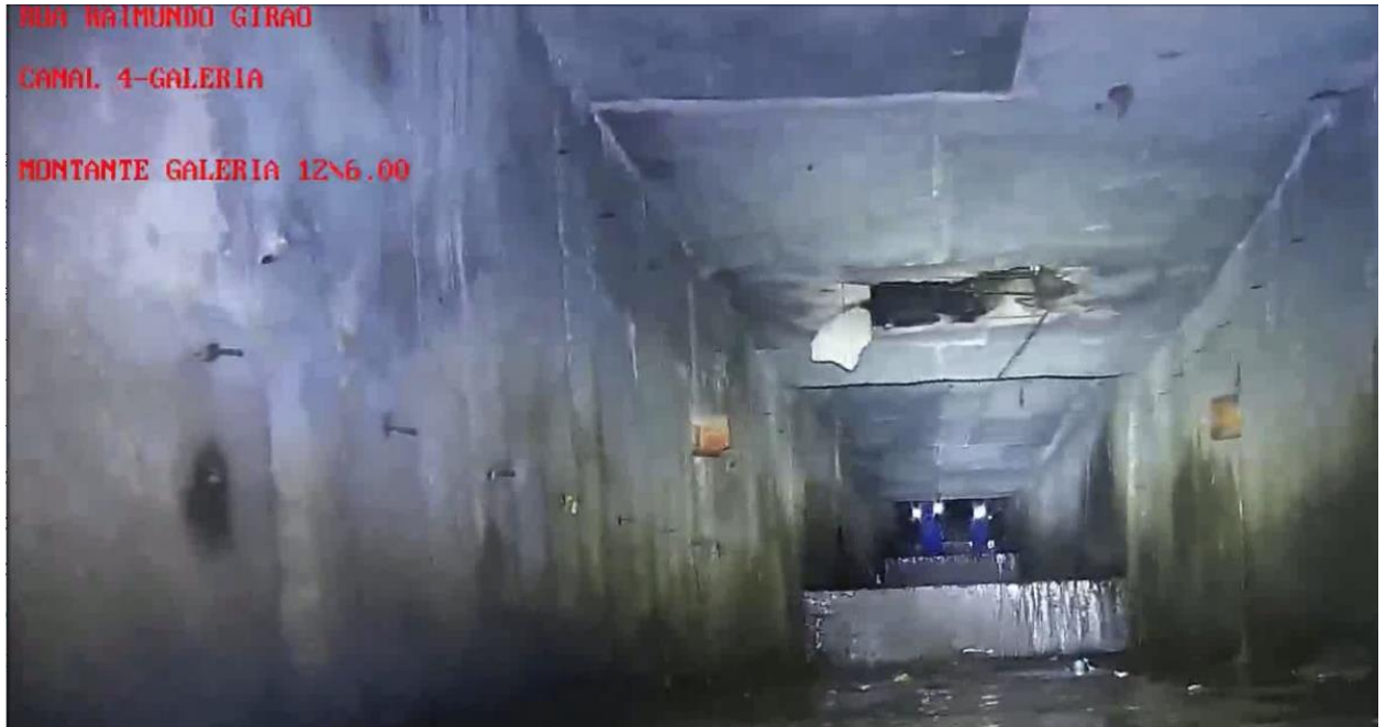
c) Foto 03