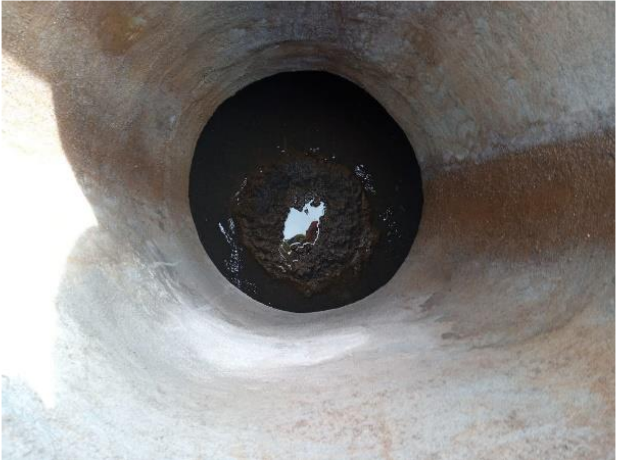
Poço de visita de drenagem com ligação clandestina de esgoto