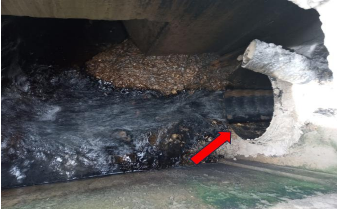
j) Foto 10