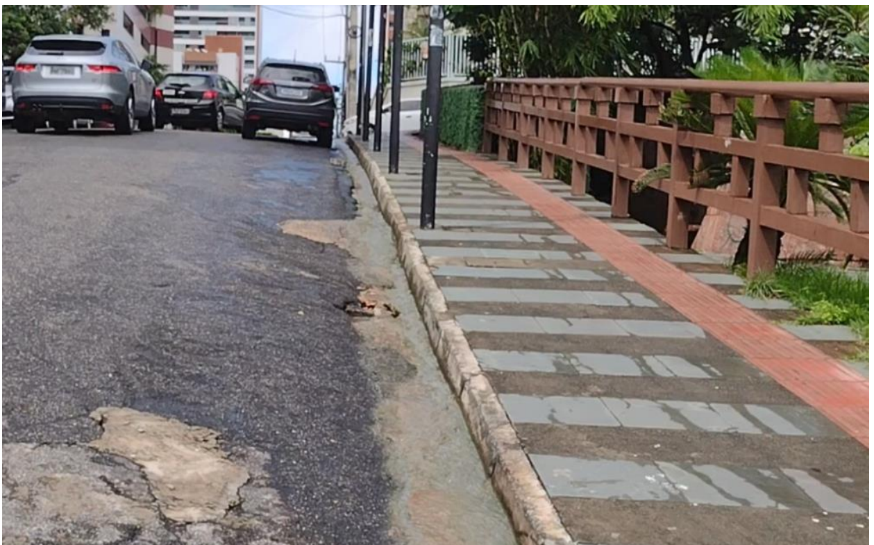
Extravasamento de esgoto para a via urbana em direção a boca de lobo do sistema de drenagem