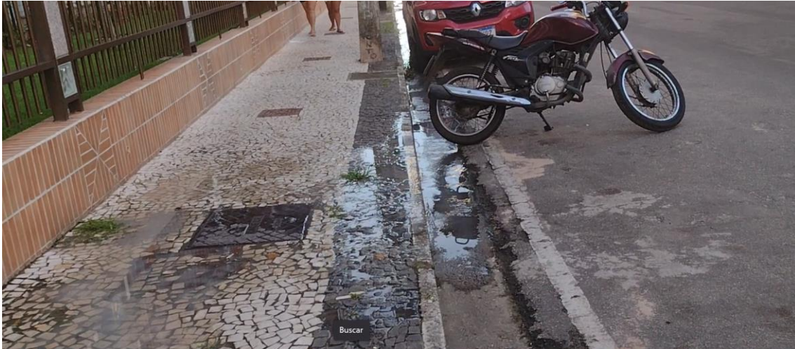
Extravasamento na caixa de inspeção